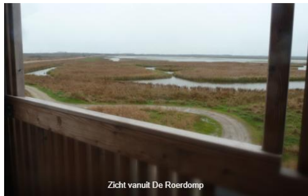
Zicht vanuit De Roerdomp

Daarna gingen we naar de nieuwe hoge vogelkijkhut De Roerdomp. Dit gebouw is pas juni 2024 geopend en met nieuwe bruggen verbonden met wandelroutes in de omgeving. Erg succesvol allemaal!