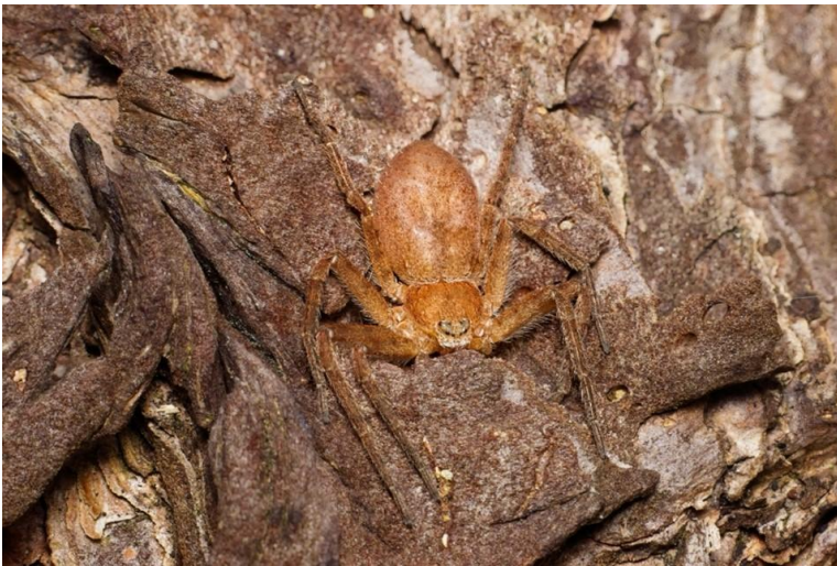
Een schorsrenspin op de stam van een dennenboom.

In het totaal hebben we in twee uur tijd een kleine twintig verschillende soorten spinnen gevonden, waaronder zeldzaamheden als de hele kleine bergspringspin met zijn prachtige rode voorkant en witte haren op de palpen, en de schorsrenspin die verborgen zat tegen de bast van een dennenboom. Maar ook de kegelspin, zandspringspin, wolfspin, driestreepspin, kraamwebspin, gewone pantserspin, heiderenspin, brede wielwebspin, boomknobbelspin, witvlekheidekogelspin, en nog een aantal andere spinnen werden gevonden en gefotografeerd.