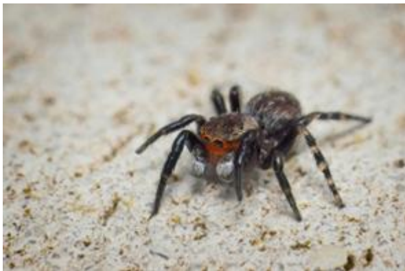
Een kleine bergspin tijdens de excursie