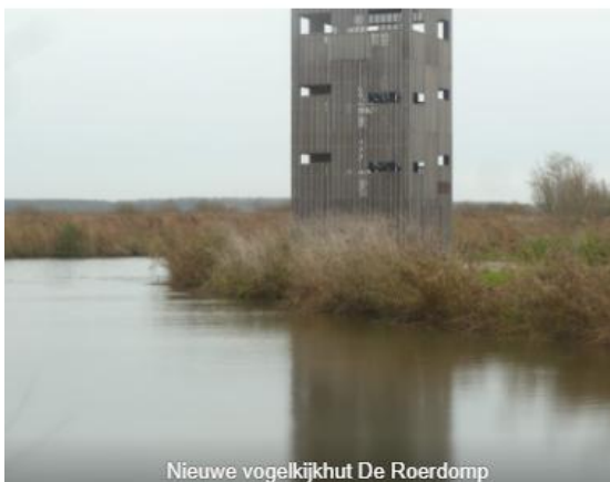
Nieuwe vogelkijkhut De Roerdomp

We vervolgden de excursie naar het bezoekerscentrum dat om tien uur opende. Na een consumptie liepen we naar de vogelhut de Zeearend. Onderweg hoorden we het geluid van een Cetti's zanger en van een Waterral. Vanuit de grote vogelhut waren veel eenden te zien als Wilde eenden, Kuifeenden, Krakeenden, Slobeenden en Tafeleenden. Ook waren Nonnetjes dichtbij zichtbaar (1 mannetje en 3 vrouwtjes).