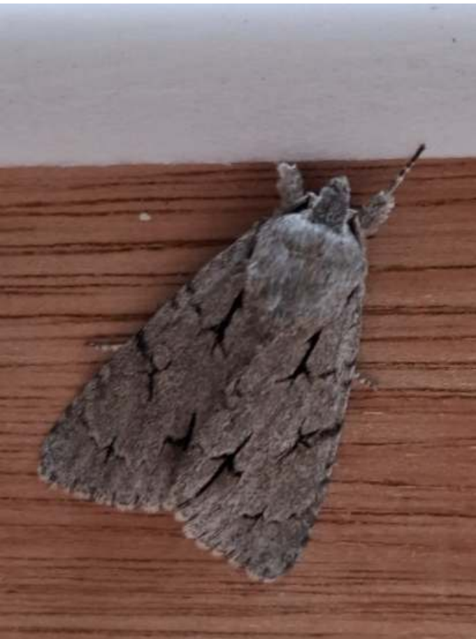
Psi-uil of Drietand