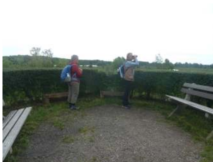
Uitzicht vanaf de Takkenhoogte