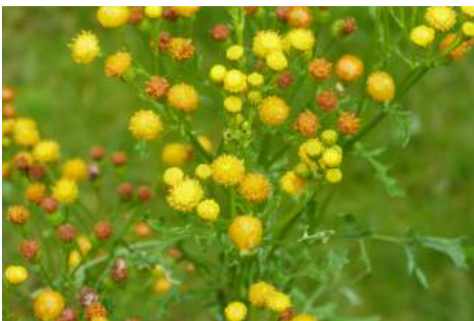
Duinkruiskruid, foto Volkert Bakker