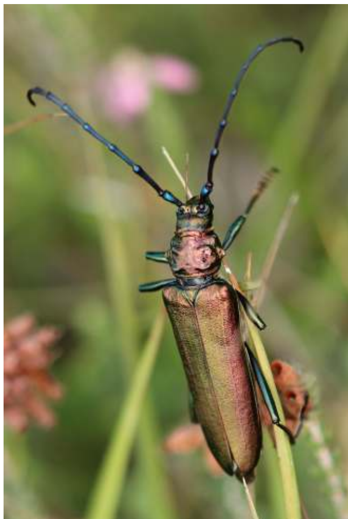
Muskusboktor, foto Annemarie Kooistra

Voor een kopje koffie of thee zal € 1,10 worden berekend.