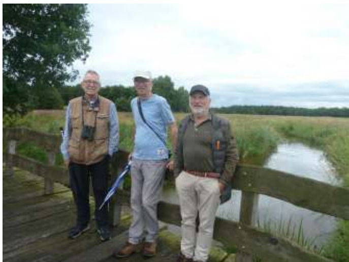
Brugje over de Reest

Tarieven per jaar dus voor 3 nummers: € 30 voor een kwart pagina € 55 voor een halve pagina € 100 voor een hele pagina