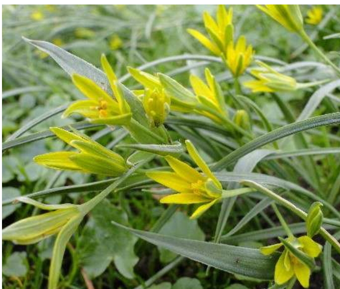
Weidegeelster, foto Peter Pfaff