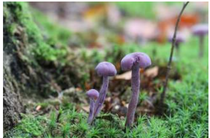
Amethistzwam, foto Annemarie Kooistra

het zogenaamde burlen. Alleen in de bronstijd maken edelherten dit geluid. Met het burlen proberen de herten stoer te doen en hinden te imponeren en te versieren. Omdat Staatsbosbeheer en Natuurmonumenten de bossen niet meer openstellen in deze tijd van het jaar, zullen we proberen 's avonds op de fiets plekken te vinden om de edelherten op afstand te horen. We rekenen € 5,- voor de minicursus. Koffie, thee en chocola zijn voor eigen rekening, € 1,- per consumptie, ter plekke af te rekenen.