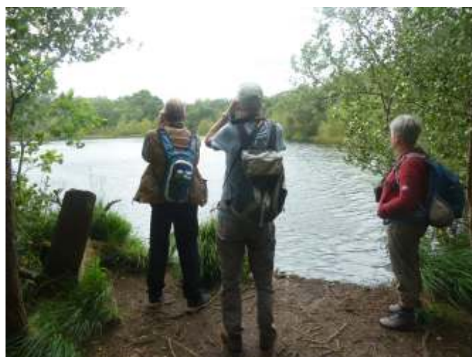
Het Spookmeertje