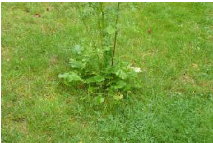
Duinkruiskruid, foto Volkert Bakker

Toen we van de week, 22 juli, op de Ermelosche heide wandelden viel het ons op dat er veel gele bloemen bloeiden. Vroeger had ik dat automatisch als Jacobskruiskruid en Boerenwormkruid benoemd. Maar nu weet ik wel beter, een deel van die gele pracht was het Duinkruiskruid. Wikipedia vermeldt dat de soort op de Nederlandse Rode Lijst van planten staat als zeldzaam en stabiel of toegenomen. Op de Ermelosche heide kun je naast het Jacobskruiskruid ook heel veel Duinkruiskruid vinden.