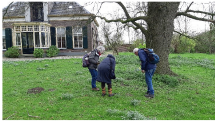
Zoektocht in de tuin met op de achtergrond de boerenhoeve