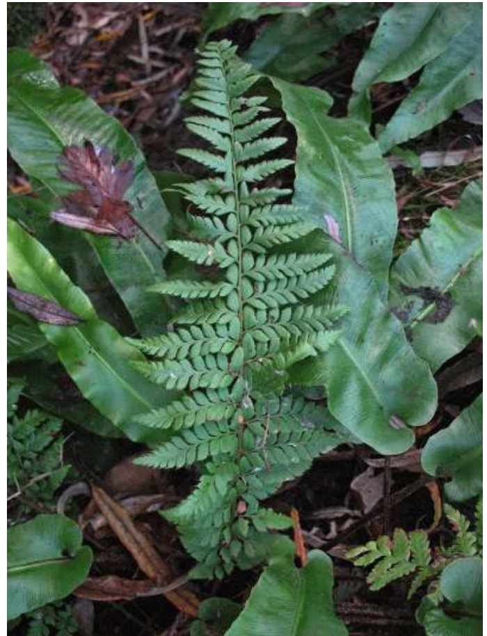
Stijve naaldvaren, Tongvaren en een klein stukje Mannetjesvaren