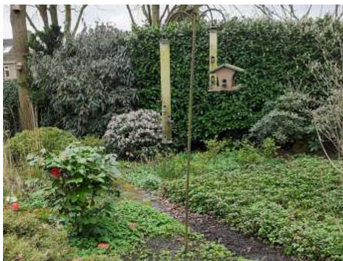
De voederpaal met daarachter de heg van links Sneeuwbal en rechts Laurierkers, foto Nico de Jong

Ook met vetblokken hebben wij wel eens geëxperimenteerd door verschillende typen aan te bieden: met zaden, naturel of