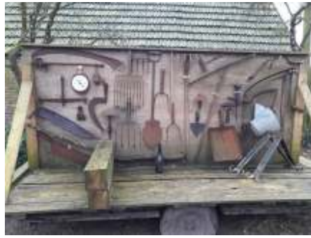
Historisch boerengereedschap, foto Ati Vijge

De deel had vroeger plek voor 16 koeien, 1 stier en 1 paard. Nu ontvangt Dirk er gasten. De wanden en zoldering zijn nog in de oude staat. Achter de boerderij staat een bakhuisje, waar vroeger het boerengezin in de zomer woonde, iedereen kon er in en uit lopen. Ook het washok is er nog, met wasteilen in diverse maten. In de boomgaard staan oude appellrassen, notenbomen en meer. Erachter ligt een stuk bouwland waar Eenkoorn, een oude tarwesoort, wordt verbouwd. En Dirk is voorzichtig begonnen met een voedselbos. Rondom het bouwland is een oude houtwal. Daarachter lopen de kippen vrij rond. Zij doen zich tegoed aan het onkruid. Er zijn veel oude machines te bewonderen, een tractor, een combine en noem maar op. En oude auto's. Verder nog allerlei oud gereedschap. Je kijkt je ogen uit! Opgeven via de website. Er kunnen maximaal 10 personen mee. Desgewenst kom je op de reservelijst en herhalen we de excursie later een keer.