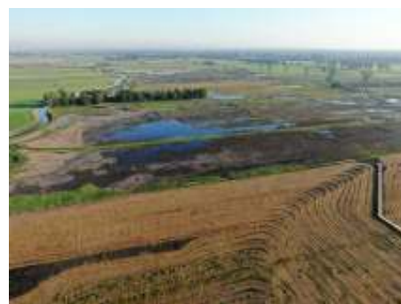
Hooilanden, foto Hans Geurtsen

We zullen eerst de Kapteinshut aan het begin van de Strandgaperweg bezoeken en daarna kijken (en luisteren) waar het op dat moment interessant kan zijn. Bij die excursie heb je bosvogels, weidevogels, rietvogels en watervogels. In het riet hoor je in de avond en nacht vaak de zang van Kleine karekiet en Rietzanger. Op de plas zijn (vooral in de winterperiode) Krooneenden te zien. Er is zelfs een pad naar genoemd, het Krooneendenpad.