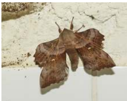
Populierenpijlstaart in de Natuurtuin

Deelnemers krijgen enkele dagen voor de excursie detailinformatie per mail.