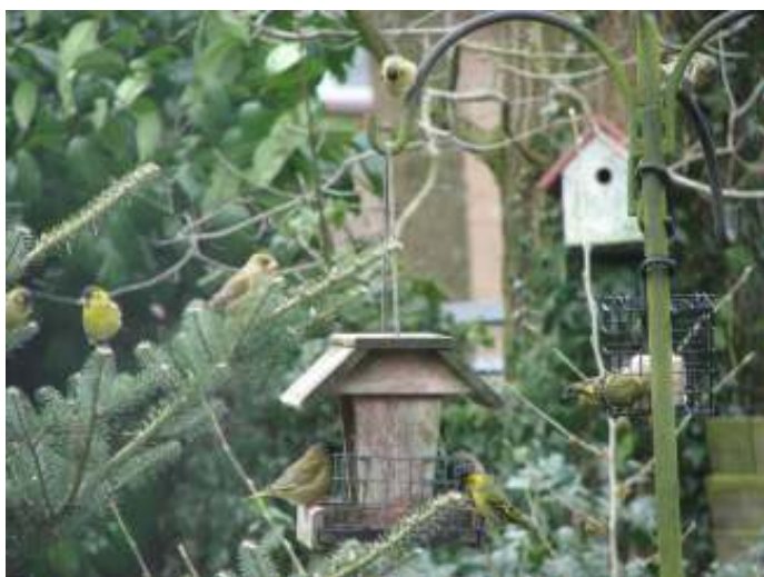
Sijsjes en Groenlingen op en rond het aangeboden voedsel en de er-naast staande Koreaanse fijnspar