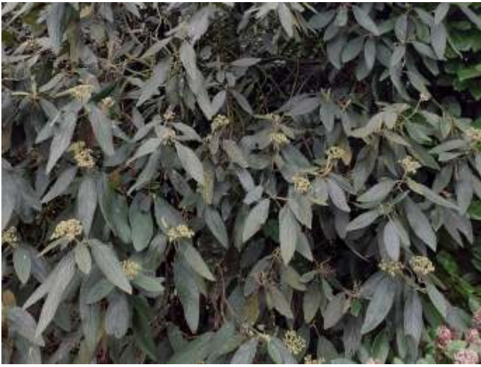
Sneeuwbal, foto Nico de Jong

met bessen. Ook die gaan veel langzamer op dan de bovengenoemde typen.