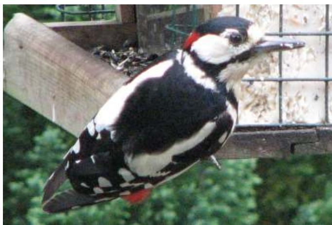
Grote bonte specht mannetje bij een vetblok met insecten

Ook wij hebben nu al een aantal jaren cilinders en huisjes voor zaden in de tuin die geregeld gevuld worden met vogelvoer. We hadden al snel vernomen dat je het beste zwarte zonnepitten kunt geven als je Groenlingen wilt bewonderen. Welnu, dat blijkt te werken. Ze hadden het al heel snel door en zitten meestal in grote aantallen aan de maaltijd van zonnebloemzaden. Vrijwel steeds krijgen ze gezelschap van Koolmezen, Pimpelmezen en Boomklevers en wat minder frequent is ook de Appelvink van de partij, met name in de winter. Uitsluitend in de winter komen er grote aantallen Sijsjes en soms Kepen. Minder regelmatig zien we Vinken en Kuifmezen. De Roodborst, de Winterkoning en de Heggemus vertonen zich ook zeer regelmatig maar dan niet of zeer zelden bij de voedercontainers. Zij scharrelen meer op de grond eronder om het gemorste afval te controleren op eetbare resten. Merkwaaardig genoeg zien we nooit een Huismus in de tuin terwijl deze toch wel in de straat in naburige tuinen gevonden wordt. Een tweede soort die volop om ons heen maar nooit in de tuin gezien wordt, is de Goudvink. Hetzelfde geldt voor de Goudhaan, die ondanks het ontbreken van naaldbomen toch af en toe in de buurt is. Wij kunnen daar nog geen verklaring voor bedenken.