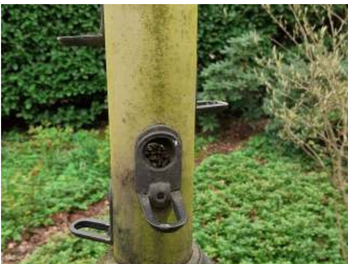
Deze zitjes gebruiken de vogels het liefst

Het succes van een paal met voedselcontainers hangt ook samen met de nabijheid van vluchtgelegenheden. Kleine vogels zijn nu eenmaal altijd op hun hoede. Terecht natuurlijk, want er kan altijd zomaar een hongerige sperwer voorbijkomen, die zich uitsluitend kan voeden met de verliezers onder de prooisorten. Tot 2021 hadden wij een steeds hogere Koreaanse fijnspaar er pal naast staan, die dan ook vrijwel veel vogeltjes in zijn takkenstructuur verborg. Nu die 'kerstboom' verdwenen is, zijn ze aangewezen op een hoge heg die iets verder weg staat. Die heg bestaat uit een combinatie van links een Viburnum rhytidophyllum , een groenblijvende Sneeuwbalsoort, en rechts een rijtje Laurierkers, Prunus laurocerasus . Nu blijkt dat de vogels bij alarm, wat in zo'n tuin uiteraard vaak voorkomt, vrijwel altijd vluchten naar de verder weg staande Sneeuwbal en daarbij de Laurierkers voorbijvliegen. Klaarblijkelijk is de structuur van bladeren en takken van beide soorten zodanig verschillend dat ze het risico nemen iets verder te vliegen.