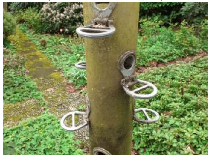
Deze zitjes zijn duidelijk minder comfortabel, foto Nico de Jong