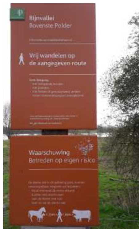
Bovenste polder

We maken een wandeling onder leiding van een gids van 'Mooi Binnenveld'. In Het Binnenveld, ten noordwesten van Wageningen, ligt een gebied van bijna 300 hectare waar volop wordt ingezet op de ontwikkeling van nieuwe natuur. Ooit was Het Binnenveld een drassig laagveengebied met grote biodiversiteit. Vanaf 1950 werd het langzamerhand hoogproductief weidegebied, maar sinds 2019 is de overgang naar nieuwe natuur weer ingezet. Het gebied, dat gezamenlijk eigendom is van Stichting Mooi Binnenveld, Coöperatie Binnenveldse Hooilanden en