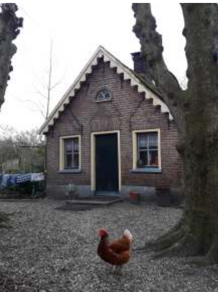
Het bakhuis, foto Ati Vijge

Bij de heerd in de voorkamer, of zoals ze hier zeggen "op de heerd", hangt bij de schouw nog de pet van opa Teunis waar hij altijd hing. Dirk en zijn vrouw slapen in de bedstede.