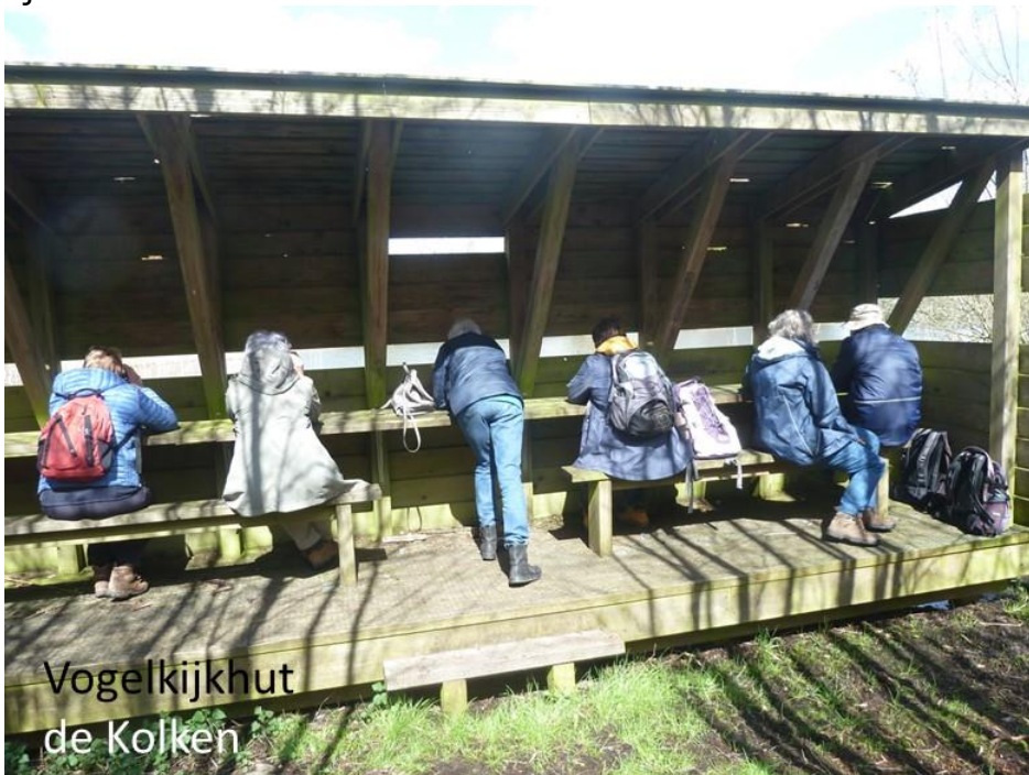
Vogelkijkhut de Kolken

Ondanks de drassige weilanden hoorden of zagen we bijna geen weidevogels. Toen we teruggelopen waren naar de auto's besloot een aantal van ons nog een vogelkijkhut (de Kolken) te bezoeken. Deze ligt dicht bij Hasselt, ten westen van het Zwarte Water. Na wat zoeken vonden we de hut met zicht op een plassengebied. Naast wat eenden en het geluid van een Cettis zanger was hier helaas niet veel te zien. We besloten daarom naar huis te rijden.