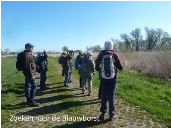
Zoeken naar de Blauwborst

Op vrijdag 14 april vertrokken we met dertien deelnemers om kwart over negen om een uur later bij het (weide)gebied de Brommerd dicht bij Hasselt te zijn. In de rietlanden vlak bij de dijk hoorden we het geluid van een Blauwborst en probeerden dit beweeglijke vogeltje tegen de felle zon in te zien. Iets verder lopend over het pad zagen we links en rechts zeer veel Kievitsbloemen uitbundig in bloei. Een groot weiland als bollenland met veel rode en wat minder witte bloemen. Af en toe "tweelingbloemen" te zien. Het pad loopt dood met zicht op het Zwarte Water.