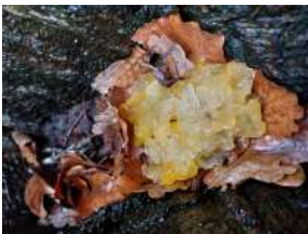
Gele trilzwam

Hoewel het behoorlijk regende bij het vertrekpunt gingen we toch met zijn achten op pad. Drie leden hadden zich afgemeld, omdat ze het weer te slecht vonden. Maar op de parkeerplaats bij Oldenaller was het droog. En dit bleef zo de rest van de wandeling. Op internet bij Nature Today stond al te lezen, dat door de kou van een dag of tien geleden er ternauwernood in het land nog bloeiende planten te vinden waren en dat was bij ons ook zo. Wel vonden we