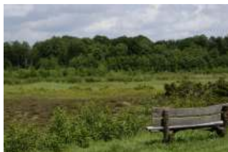
Het Kienveen

Vertrek: Ermelo 8.45 uur, Harderwijk 9.00 uur. Let op! Tijdelijk een andere carpoolplaats in Harderwijk. Tijdens deze wandeling lopen we door de bossen rond landgoed Velhorst naar het Kienveen, waar we langs een prachtig uitzichtpunt komen. Dit veen is midden jaren negentig van de vorige eeuw afgeplagd, onder meer om het Melkvioltje terug te krijgen. Ook konden op deze wijze de juiste omstandigheden worden gecreëerd voor Vetblad, Moerashertshooi en Kleine zonnedauw. Vetblad is een vleesetende plant, die bloeit vanaf eind mei tot en met juni met een bijzondere blauwviolet bloem. Hopelijk bloeien ze in de tijd dat wij er zijn. Na de lunch gaan we vanuit Almen varen op de Berkel. We stappen om 14 uur in een nagebouwde Berkelzomp, een platboomd scheepje dat kan worden gezeild, geboomd of getrokken, een type zoals men vroeger op de Berkel