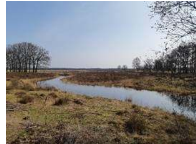
De Houtbeek

De grote variëteit aan interessante biotopen in dit gebied, zoals droge en natte heide, stukjes stuifzand, schrale bermen, loof- en naaldbossen en de cultuurhistorisch zo belangrijke Houtbeek, maakte ons nieuwsgierig. Kortom, voor plantenliefhebbers leek hier nog van alles te ontdekken en te beleven. Onze opzet was om in 2022 drie maal het terrein te bezoeken en hierbij op drie verschillende locaties zo veel mogelijk soorten te vinden. Uiteindelijk hebben we het gebied op 17 mei, 6 juli en 5 september bezocht.