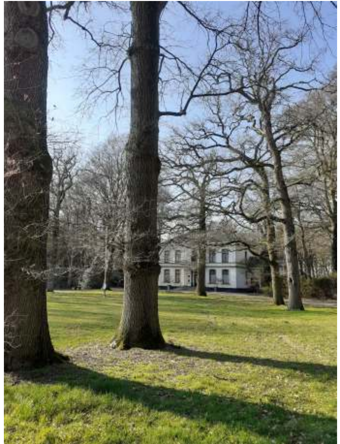
De Grote Bunte

De KNNV afdeling Noordwest-Veluwe was van mening dat de plannen zich niet verdragen met een zorgvuldig behoud en beheer van het landgoed. De KNNV stond daarin niet alleen want ook de Vereniging Heemschut en de Nederlandse Tuinenstichting waren dezelfde mening toegedaan en dienden ook een zienswijze in. Tijdens een hoorzitting van de bezwarencommissie in september 2022 heeft de KNNV samen met de andere organisaties een pleitnota ingebracht omdat wij niet tevreden waren over het conceptbesluit van de gemeente. Zo hebben wij ingebracht dat het onderzoek naar beschermde planten-