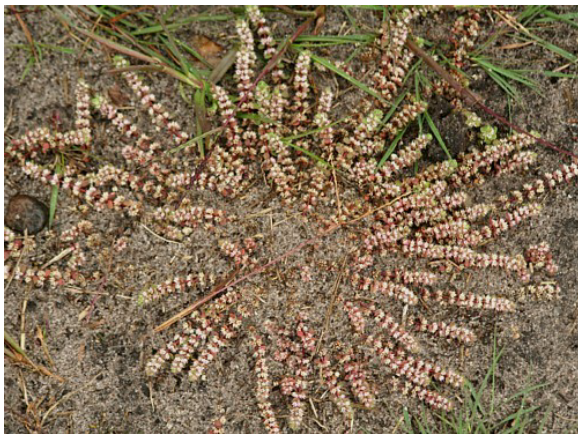
Grondster, foto Peter Pfaff

De tot nu toe verzamelde gegevens zijn ingeleverd bij Floron, maar in de loop van 2023 gaan we het gebied nog 1 of 2 keer bezoeken (zie het excursieprogramma elders in dit blad). Wij gaan voor nog veel meer soorten. Gaat u ook mee?