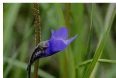
Vetblad, foto Ati Vijge

gebruikte om goederen van en naar Duitsland te vervoeren. We varen in een rustig tempo op de inmiddels weer meanderende rivier. De natuurlijke bochten zijn aangelegd om meer soorten vissen, vogels en planten terug te krijgen. De bochten in de rivier zorgen voor een hogere stroomsnelheid in de buitenbochten. Dit geeft steile oevers waar Ijsvogels en Oeverzwaluwen kunnen nestelen. De boottocht duurt 1 uur en kost € 6,- p.p. Uiterlijk 16.00 uur zullen we weer naar huis rijden. Opgeven via de website tot en met vrijdag 19 mei i.v.m. bespreken van de boot. Voor informatie Ati Vijge, 0341-560901 of awvijge@outlook.com.