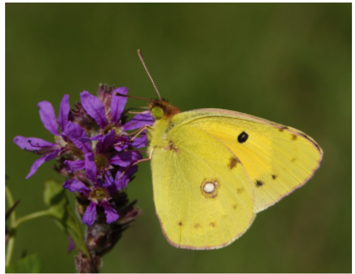
Oranje luzernevlinder

Na deze statutenwijziging zullen alle afdelingen ook hun sta-