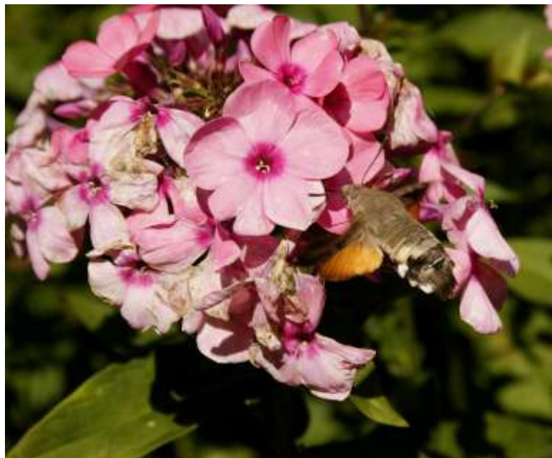
Kolibrievlinder op vlambloem

Mooie en natuurlijke soorten zijn: Agastache 'Blue fortune' of 'Spicey' (dropplant), Aster 'Lutetia', 'Twilight', 'Thompsonii' of Aster novae angliae 'Millennium Star' of 'Herbstschnee', Astrantia 'Roma' (Zeeuws knoopje), Calamintha nepeta nepeta 'Blue Cloud' (bergsteentijm), Echinacea 'Rubinstern' (zonnehoed), Echinops ritro 'Veitch Blue' (kogeldistel), Eupatorium maculatum 'Gateway' (leverkruid), Helenium 'Eldorado' of 'Moerheim Beauty' (zonnekruid), Helianthus 'Carine' of 'Lemon queen' (vaste zonnebloem), Lythrum virgatum 'Rose Queen' (Kattestaart), Monarda 'Saxon Purple' (bergamotplant), Origanum 'Rosenkuppel' (marjolein), Phlox paniculata 'Katherine' of 'David' (vlambloem), Prunella grandiflora bijvoorbeeld 'Freeland Blue' of 'Yukushimana', 'Icing Sugar' (bijenkorfje), Rudbeckia 'Triloba' (zonnehoed), Salvia nemorosa 'Blauhugel' (salie), Salvia verticillata 'Purple Rain', (kranssalie), Scabiosa caucasica 'Staefa' (duifkruid) en Sedum 'Abbey Dore' of 'Carl' (vetkruid).